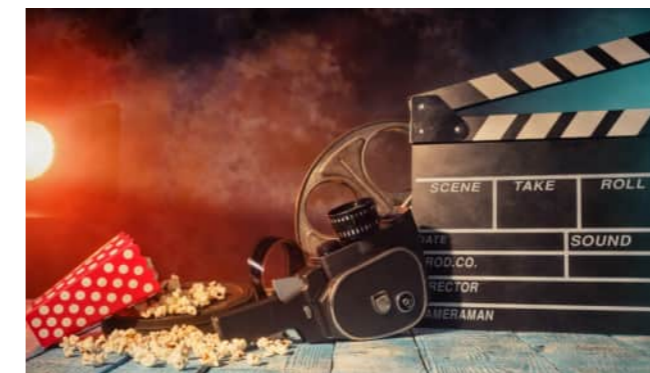
Kurzfilm im Religionsunterricht