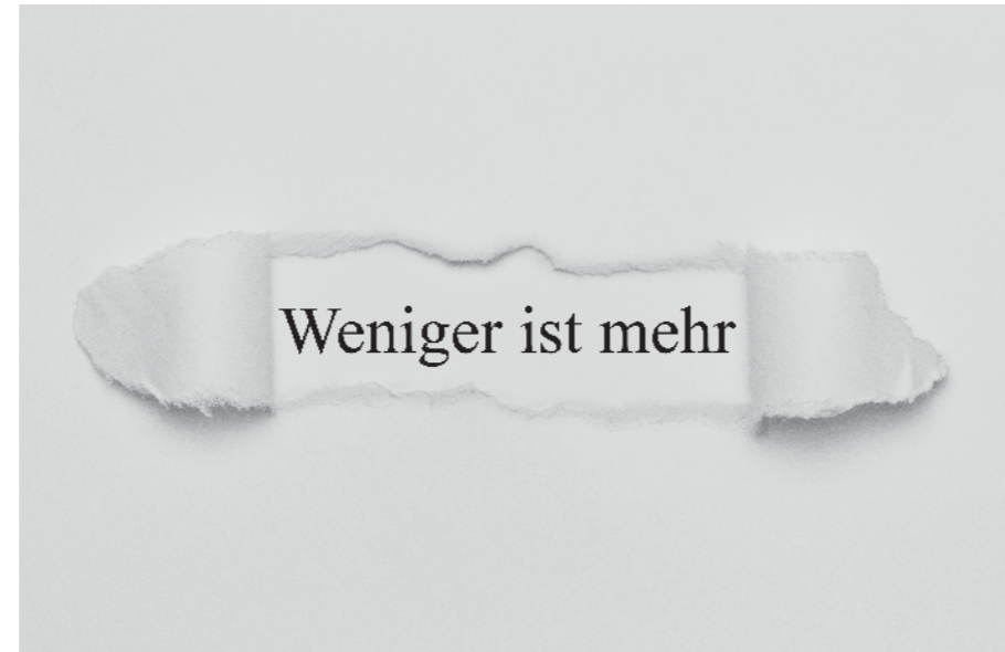
Kantonaltagung Fasten - weniger ist mehr