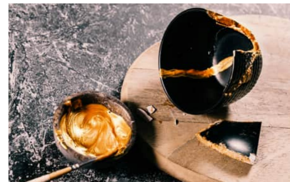
Kintsugi - Versöhnung mit Scherben