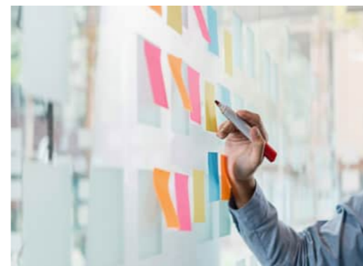
Einführung in den Lehrplan RU siehe ru-im-puls.ch