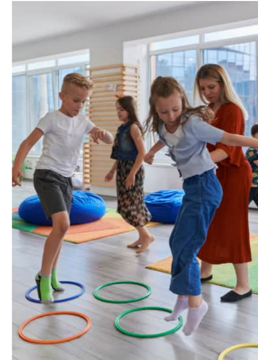
Spiele im Religionsunterricht