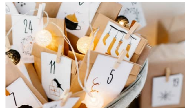
Advent mit Kindern und Jugendlichen - siehe ru-im-puls